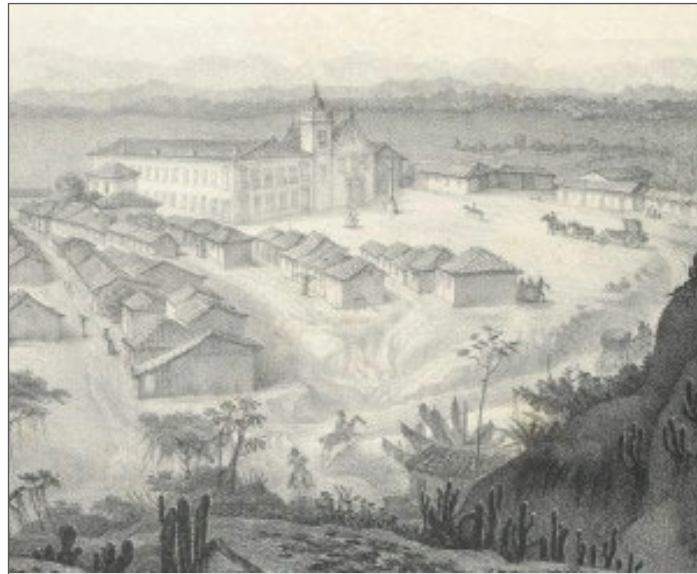
Figura 1 – Imagem litografada do castelo imperial de Santa Cruz