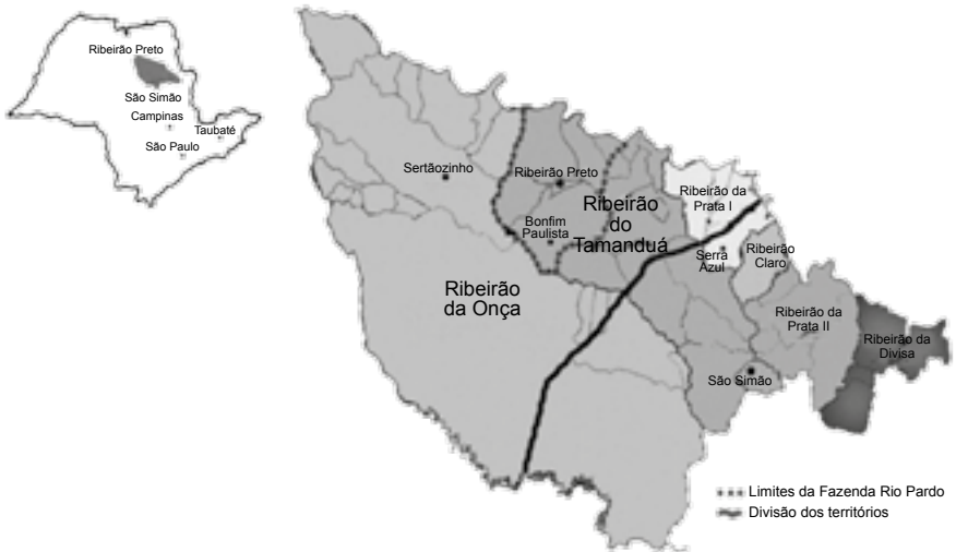
Mapa 2 – Antigo município de São Simão (século XIX)

Fonte: Modificado a partir de: Bazan, Antigo município de São Simão. Situação geográfica no século XIX. Mapa b&p. Escala 1:200.000. In: Martins (1998). Em destaque pontilhado, está a área da antiga Fazenda Rio Pardo, apossada originalmente pela família Dias Campos na primeira metade do Oitocentos.