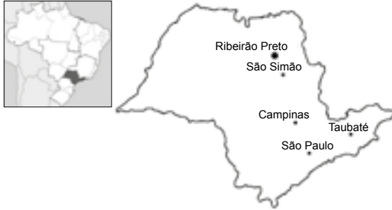
Mapa 1 – Localização de Ribeirão Preto