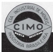
Figura 4 – Logomarca da Cia. Industrial de Móveis S/A

Ampliar a competitividade e facilitar a compra de ferramentas, vernizes e outros materiais importados da Europa figuraram entre os vetores da conglomeração, a logomarca da qual rapidamente se tornou bastante conhecida (Figura 4). Já a partir do ano seguinte, essa estrutura, que registrava mais de 5 mil empregos diretos em todas as suas atividades, contou com as instalações de um amplo edifício construído na área central de Rio Negrinho, naquele momento ainda um distrito de São Bento do Sul.