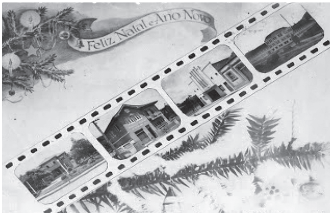
Figura 6 – Cartão de Natal do município de Rio Negrinho, década de 1940

Não é, portanto, desprovida de razão a análise de Santi, segundo a qual a Móveis CIMO “lançou bases para outras empresas hoje consideradas de ponta no setor, como é o caso da Rudinik, fábrica de móveis de grande porte, localizada em São Bento do Sul” (Santi, 2000, p. 18). É difícil imaginar, há de se convir, uma melhor ilustração para a ideia de foco gerador de iniciativas empreendedoras.